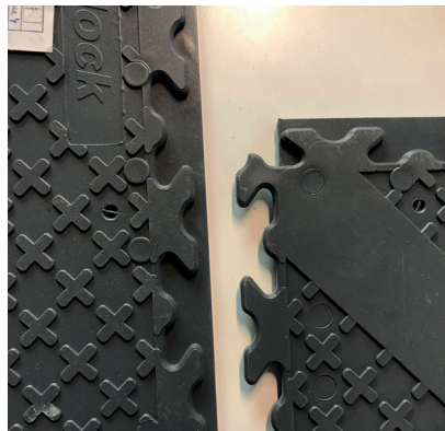
ÜBERLAPPENDE VERBINDUNG OFFEN