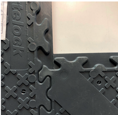
FLIESEN VON UNTEN GESCHLOSSEN